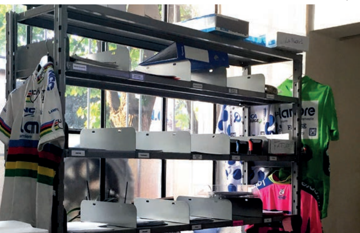
*Separatori, accessorio aggiuntivo. / Separators, additional accessory.

* portata per ripiano, peso uniformemente distribuito shelves capacity with an evenly distributed weight